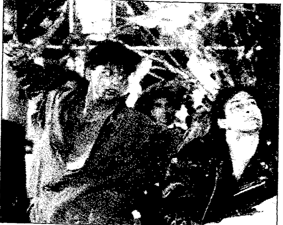
الممثلون شراوخ خان (اليسار) وسلمان خان (اليمين) في مشهد فتالي في اثناء تصويره في بومباي في تشرين الاول